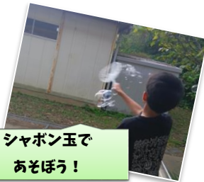
シャボン玉であそぼう！