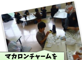
マカロンチャームを作ろう！